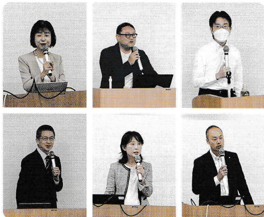
様々な専門家や先輩創業者、金融機関職員等が講師となり、創業のノウハウを伝授しました

午前の授業では、WEBやSNSのビジネス活用について最新の動向を学び、活用法を全員で実践しました。午後は創業者が躓きやすい会計業務の基礎についてお伝えしました。